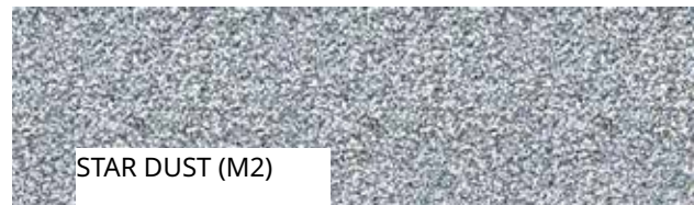
STAR DUST (M2)